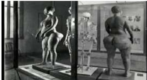
Musée de L`Homme, Paris 1815- 1974

A los 26 años Sara, alcohólica y enferma, muere en París, en soledad, en el año 1815. Su cuerpo fue expuesto como estatua de yeso desde 1815 hasta 1974 en el Museo del Hombre, París. Tanto su cuerpo como sus genitales habían sido expuestos por 159 años en vitrina.