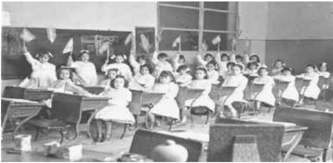
Espacio de aula de escuela pública metropolitana principios del siglo XX

-ya uniformados por la gramática escolar- presupone una avanzada que sobrepasa los muros de la escuela.