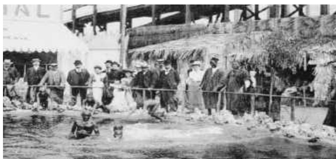
Show “Baño de negros” Jardín de Aclimatación de París en 1896

Uno de los shows que se ofrecían se denominó “Baño de negros”, en donde niños en encierro debían hacer acrobacias en el agua para encontrar las monedas que desde afuera se les arrojaban.