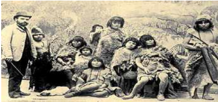
Exposición Universal, Paris, 1889.

enfermedad venérea desconocida por los selknam. El periplo de estas exposiciones va desde Francia, hasta Bélgica, Inglaterra y más. Es el gobierno de Inglaterra el que exige al gobierno chileno que se haga cargo de estos “ciudadanos”. Pero Chile duda de la nacionalidad de estas comunidades y no agiliza el retorno de los pocos que quedaban vivos. Más adelante informan que no tienen fondos para cubrir el retorno de los selknam y es Inglaterra quien deporta a los indígenas chilenos y los embarca de regreso a Chile, seis regresaron, uno quedó en Uruguay y otro queda en Europa por propia voluntad. Lo dramático del regreso fue, entre otras cosas, saber que el destino eran las reducciones indígenas y que el territorio de los fueguinos había sido, en complicidad con el Estado chileno, arrebatado para la industria lanar.