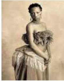
Saartjie / Sara Baartman 1789 - +1815