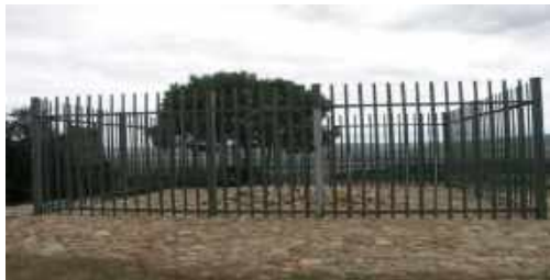
Tumba de Saartjie Baartman, zona de Río Gamtoos, Àfrica