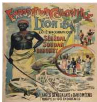
Publicidad de la Exposición colonial, Lyon, 1894

verso fenómeno de racialización moderno colonial. Como sostiene Aníbal Quijano, la perspectiva del eurocentrismo “se impuso como mundialmente hegemónica en el mismo cauce de la expansión del dominio colonial de Europa sobre el mundo” (Quijano en Palermo y Quintero, 2014, p.121). Insistimos, era un imperativo político-epistémico destacar la superioridad de occidente al interior de la comunidad europea.